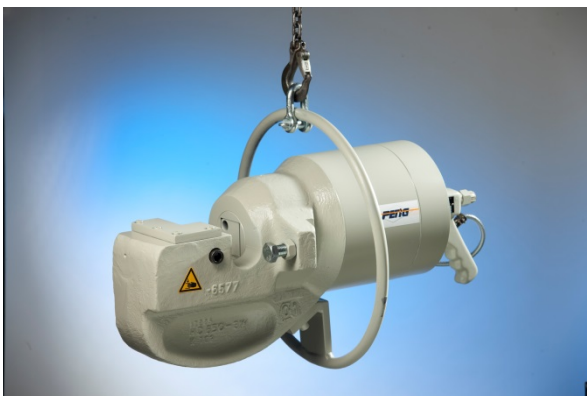
Abb. ähnlich / similar to photo