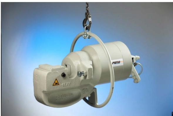
Abb. ähnlich / similar to photo