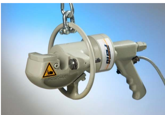
Abb. ähnlich / similar to photo